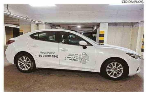
PUCV CONTARÁ CON MÓVILES DE SEGURIDAD EXCLUSIVOS.

En Playa Ancha, por su parte, la prioridad de la UPLA no solo está en proteger a sus alumnos de incivildades, sino que también protegerlos de la inseguridad vial que se registra en este sector: Esto a propósito del fatal ac-