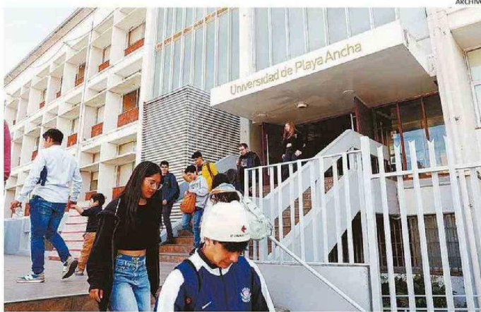
ENTRE ESTA Y LA PRÓXIMA SEMANA, LOS UNIVERSITARIOS COMENZARÁN SUS RESPECTIVAS CLASES.

En la Ciudad Jardín, en tanto, esto funciona en subida Los Lirios, lugar donde