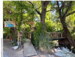
EL BOSQUE. Así es la entrada al arbolado jardín de este restaurante de Horcón.