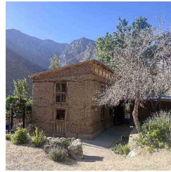
CASA ESPEJO. Este proyecto rescata la arquitectura del valle con una mirada actualizada.

una alternativa de turismo lento y sostenible en esta zona alejada y rural del norte de Chile.