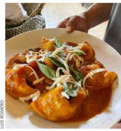
EL CIELO. Este restaurante ofrece comida casera y gourmet.