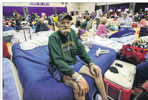
La secundaria River Ridge, en New Port Richey, albergó a 700 evacuados.