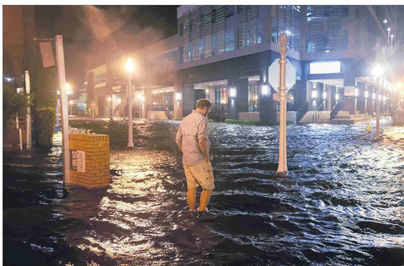
Habitante de Sarasota camina entre las aguas que inundaron la localidad después del desembarco del Huracán Milton.

Aunque bajó su intensidad al tocar tierra, igual generó enormes daños. "Hemos perdido algunas vidas", dijo el alguacil del condado de St. Lucie.