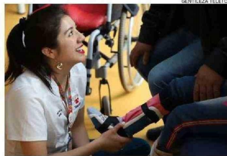
DESTACARON TRABAJO EN MATERIA DE REHABILITACIÓN.

Por otra parte, realizaron la Jornada Regional de Educación Inclusiva, en la cual participaron representantes de la comunidad educativa de la región de Los Ríos.