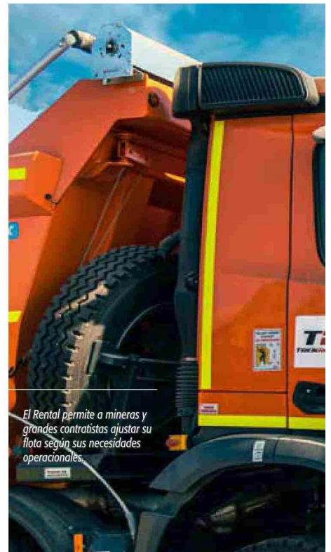
El Rental permite a mineras y grandes contratistas ajustar su flota según sus necesidades operacionales.

Respecto a este último punto, Vallauri comenta que Trek Rental cuenta con talleres propios en la zona norte de Chile, “estratégicamente ubicados con personal altamen-