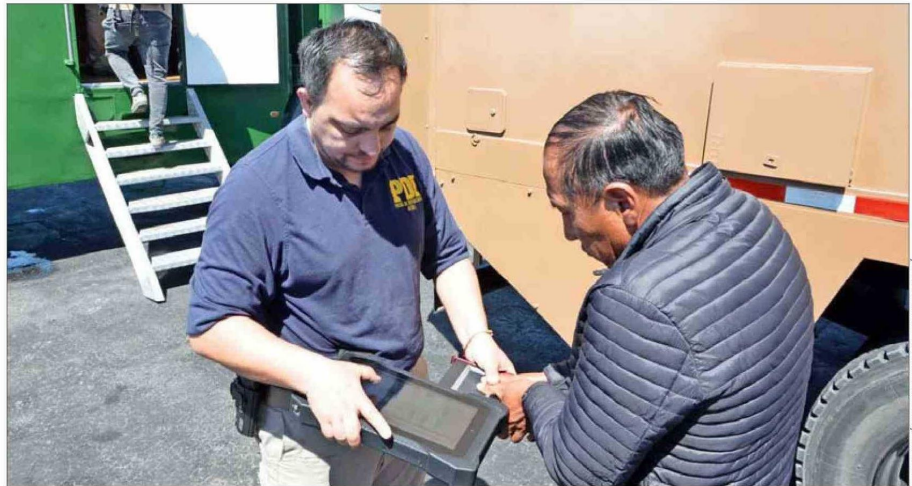
INVERSIÓN. — Cerca de US$ 6 millones le costó implementar el sistema al Gobierno Regional de Arica.