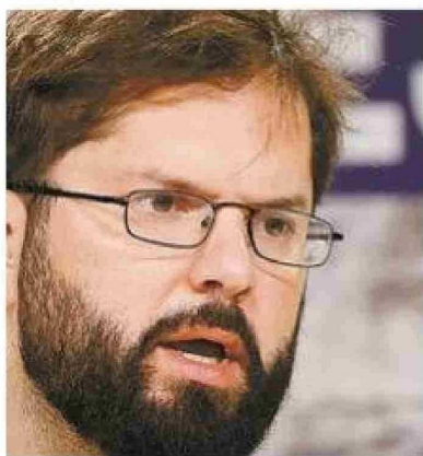
El Presidente Gabriel Boric.

El Mandatario aseguró ayer durante el evento "Encuentro por Chile", el cual reunió a diversas universidades y representantes de organismos, que el Ejecutivo está trabajando para apuntalar la inversión y el crecimiento económico en el país, pero aseguró que para ello se requiere de la "confianza" del sector privado. "En Chile hemos logrado aumentar de ma-