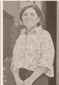
PAULINA SABALL, EXMINISTRA DE ESTADO.

“Estoy de acuerdo con la aseveración, lo que implica, por ejemplo y respecto de la propuesta presentada recientemente a discusión en el Congreso Nacional, remirar (para eliminar) la posibilidad que ahí se otorga de generar federaciones o fusiones de partidos, tras el primer proceso electoral al que aplicaría, pues ello se contraponen al objetivo. También me parece que implica entender que esa reforma es (o puede ser) el principio de otras más sustantivas que debieran discutirse a propósito de esta relevante materia”.