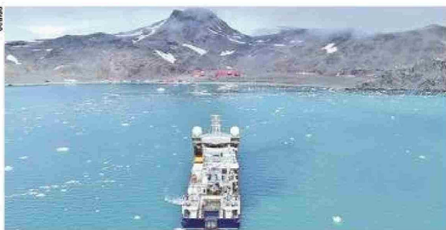
El buque oceanográfico Odón de Buen llegando a la base española Juan Carlos I en la isla Livingston.

El viaje de la ministra se enmarca en una campaña de investigación experimental