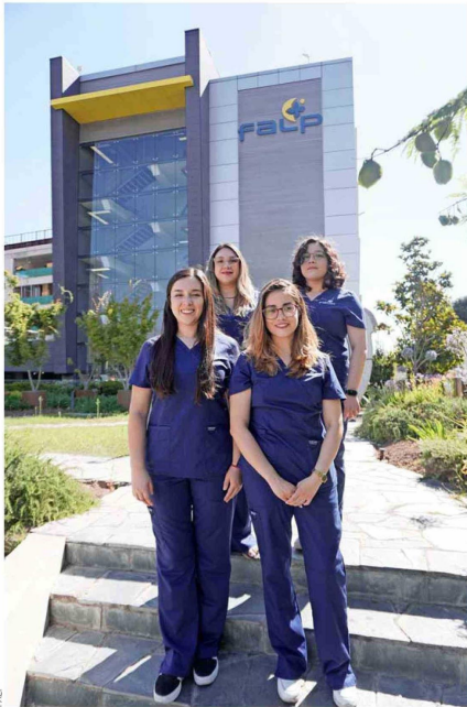
El equipo del Programa Oncoguía.

Los sistemas de salud suelen ser complejos y desarticulados, planteando desafíos a las personas que enferman, las que muchas veces no saben cómo usarlo de forma efectiva. Esto les genera una experiencia negativa, llegando incluso a abandonar sus tratamientos. ¿Cómo ayudar a alguien con cáncer o a su red de apoyo en este tránsito que implica tantas aristas? Es lo que el Instituto Oncológico FALP se planteó en 2022 y, siguiendo un modelo que es exitoso a nivel mundial, creó el primer programa de navegación en salud oncológica en Chile, llamado Oncoguía. Este acompaña a personas afectadas por el cáncer de forma telemática durante toda la trayectoria de la enfermedad, desde la sospecha de un diagnóstico hasta las etapas posteriores.