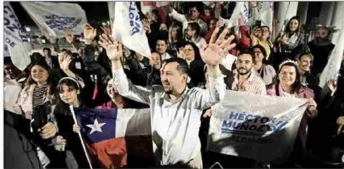
El ganador fue concejal y luego seremi de Salud en plena pandemia. Junto a sus adherentes llegó a la plaza Independencia a celebrar.