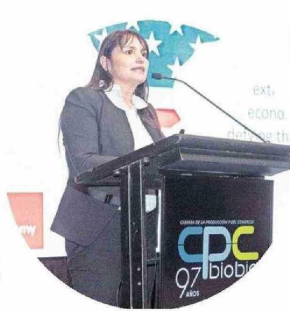
La destacada economista Michéle Labbé fue la encargada de exponer en la actividad.