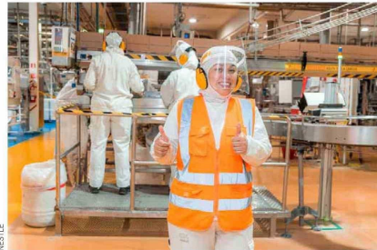
Esta feria laboral virtual no solo proporcionará oportunidades de trabajo sino también será una instancia de aprendizaje para los jóvenes vinculados a la digitalización e innovación.

A través de la “Iniciativa por los Jóvenes”, Nestlé busca impactar a 10 millones de jóvenes a nivel mundial para 2030 con capacitación y herramientas para su incorporación al mercado laboral.