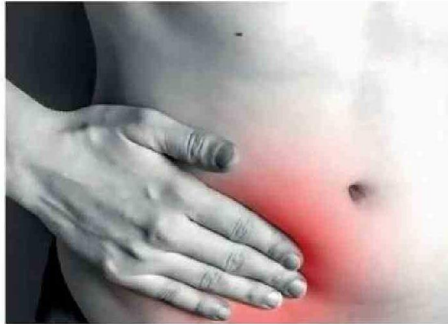
DISTINTOS TIPOS DE HERNIAS PUEDEN APARECER.

En cuanto a los síntomas, el especialista señala que estos pueden variar dependiendo del tipo y ubica-