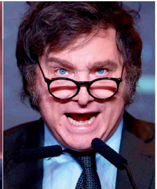
► El Presidente Boric ha conversado el tema personalmente con su par de Argentina, Javier Milei.

gustó en Chile y que forzó al Presidente Boric a elevar el tono: que el gobierno argentino haya afirmado que recién removerían los paneles durante el verano. Eso generó molestia en el Ejecutivo, puesto que, según reafirman, es Chile quien decide la fecha, no Argentina. En ese contexto, luego de participar en Unesco, el propio Presidente decidió hablar y puso el tema sobre la mesa.