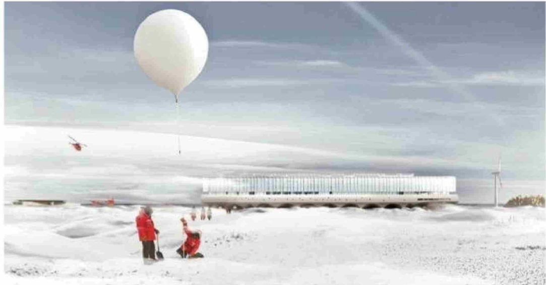
La imagen virtual muestra una panorámica del edificio en invierno.

El objetivo del Cai es claro: transformarse en el principal espacio de cooperación regional, nacional e internacional para el desarrollo de la ciencia y la cultura, además de potenciar a Punta Arenas como el centro logístico más importante como puerta de entrada a la zona occidental de la Antártica. No menor es una tercera meta: incentivar a la población a sumergirse dentro de la cultura