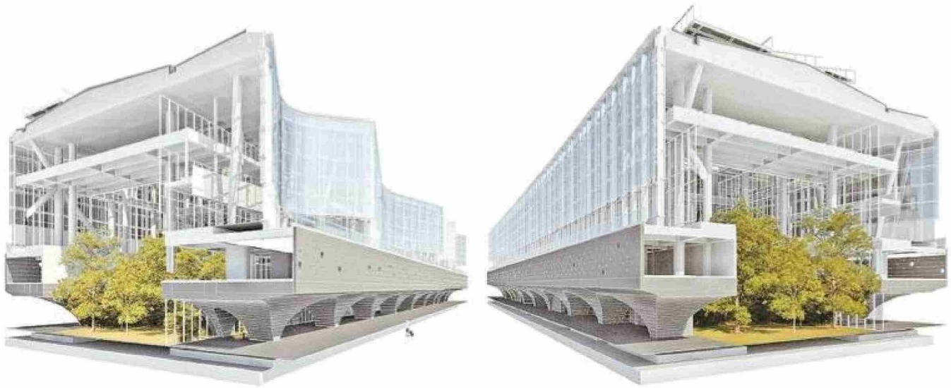
Los cortes permiten observar cómo se integrarán todos los elementos concebidos para hacer único este proyecto.