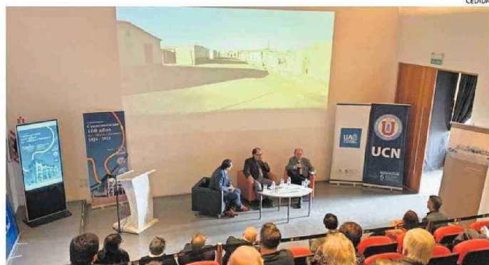
POR LA IMPORTANCIA QUE TIENE PARA LA REGIÓN Y EL PAÍS MANTENER EL LEGADO DE CHACABUCO.

En conversatorio organizado por la Corporación Museo del Salitre Chacabuco, la UCN y la UA, especialistas abordaron estado actual y proyección del monumento nacional.