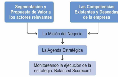
Figura 2. El proceso de definición de la Misión y de la Agenda Estratégica

Posteriormente siguen los otros pasos: la definición de misión y los cambios que implica en la propuesta de valor a clientes, el ámbito y las competencias distintivas; la definición de la "agenda estratégica", que contiene información detallada de los "programas de acción estratégicos" con una clara definición de plazos,