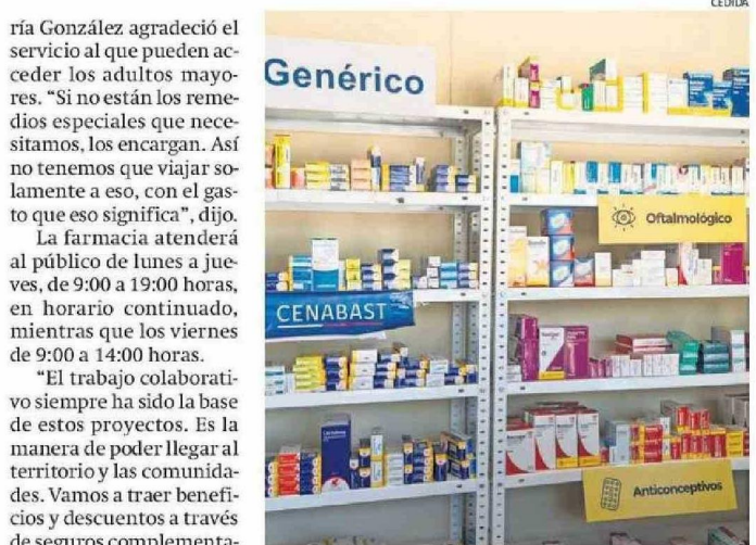
CUENTA CON UN RENOVADO CATÁLOGO DE MEDICAMENTOS.

con los habitantes de María Elena, el municipio local y Minera Antucoya.