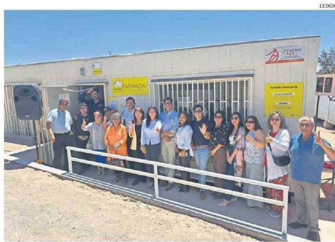
LA FARMACIA FUE REABIERTA DESPUÉS DE UNOS MESES DE UN RECESO ADMINISTRATIVO.

La farmacia contará con nuevos medicamentos además de telemedicina, lo que será una alternativa para que los vecinos no se desplacen a otras comunas de la región.