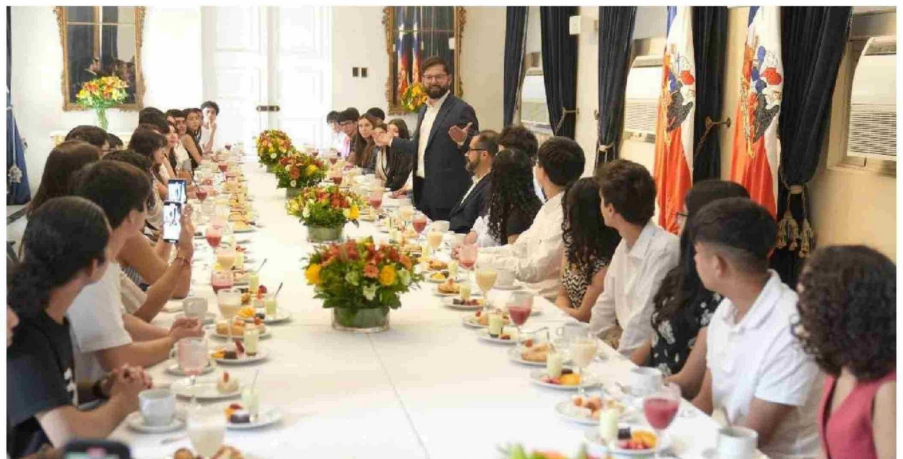
EL PRESIDENTE GABRIEL BORIC se reunió con los puntajes máximos de la PSU en el Palacio de la Moneda.

Desde Diario La Tribuna se intentó contactar con todos los destacados de la provincia, quedando algunos de ellos sin localizarlos o sin entregar respuesta al medio de comunicación.