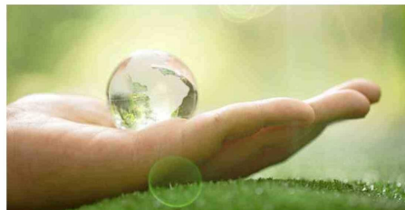
Para cuidar el planeta es esencial el trabajo mancomunado de gobierno, empresas y la sociedad civil.

impulsar la transición energética y disminuir las emisiones de gases de efecto invernadero sin perder eficiencia? “El avance debe estar marcado por la reducción en el consumo de energía o el cambio a fuentes renovables o de bajas emisiones de carbono, al tiempo que se replantean los sistemas energéticos, las infraestructuras y las cadenas de suministro que utilizan. El gran objetivo es contribuir a alcanzar la meta