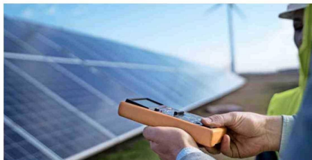
La ingeniería y el diseño juegan un importante papel en la descarbonización.

deben establecer políticas que apoyen el desarrollo de las energías renovables, como subsidios, incentivos fiscales y cuotas de mercado. Las empresas deben invertir en tecnologías y desarrollar nuevos modelos de negocio. La sociedad civil debe sumarse a este desafío, sensibilizarse sobre su importancia y exigir al ámbito público y privado actuar”, afirma.