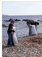
Más de 9 toneladas de basura fueron retiradas desde Chañaral de Acetum, en Atacama, caleta de interés turístico por ser uno de los principales puntos de avistamiento de ballenas del país. | C 10

Laguna de Aculeo presenta importante recuperación Luego de los sistemas frontales en la zona centro sur, las precipitaciones acumuladas han logrado revivir lagunas y embalses desaparecidos por la sequía. Entre ellas la laguna de Aculeo, en Paine, que presenta actualmente cerca de un 60% de su capacidad total. Ello ha provocado también la reaparición de las aves y otra fauna del sector. De todas formas, expertos advierten que, por su dependencia de las lluvias, podría volver a secarse. | C 11