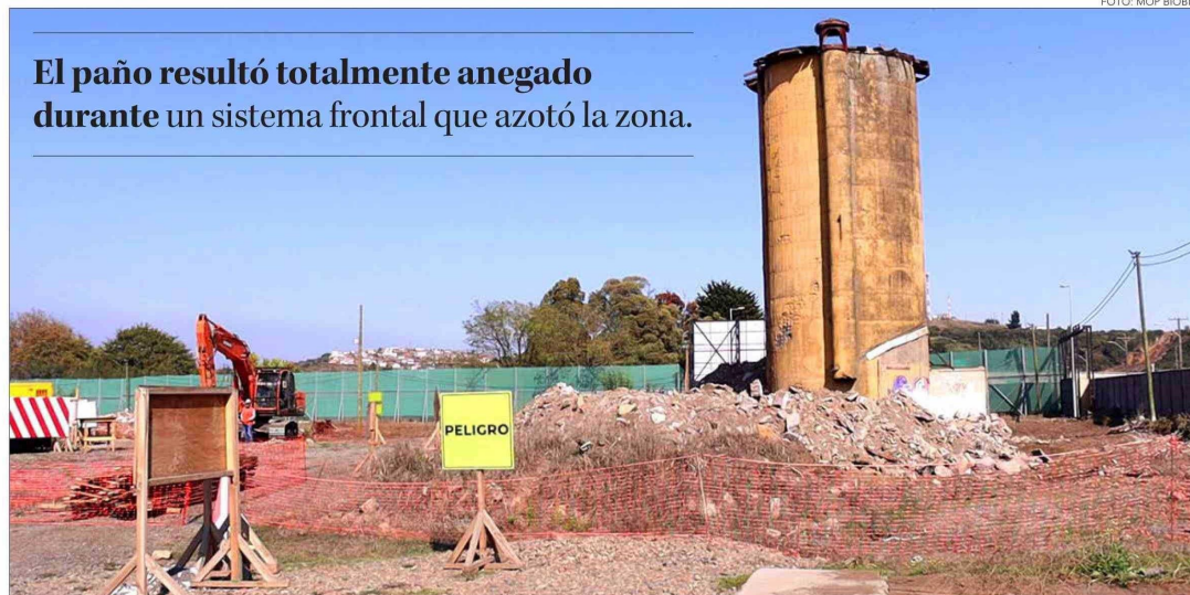
El paño resultó totalmente anegado durante un sistema frontal que azotó la zona.

Agregaron que en el Contrato de Concesión de la Red de Hospitales Biobío se encuentra vigente, en fase de construcción, que incluye la realización de los proyectos de ingeniería de detalle.