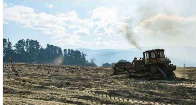
EL VERTEDERO DE MORROMPULLI RECIBE RESIDUOS DE LAS DOCE COMUNAS DE LA REGIÓN.