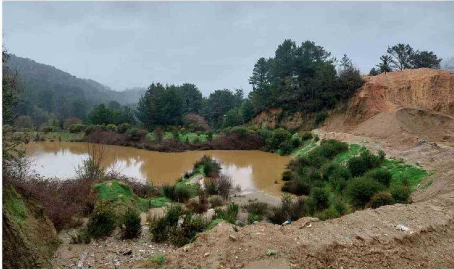
EN 2023 SE PRODUJO UNA AVALANCHA DE BASURA EN EL VERTEDERO MORROMPULLI, LA CUAL TRAJÓ CONSECUENCIAS PARA EL MUNICIPIO.

fueron formulados a la Municipalidad de Valdivia por la Superintendencia del Medio Ambiente el año pasado, tras la avalancha en el vertedero de Morrompulli.