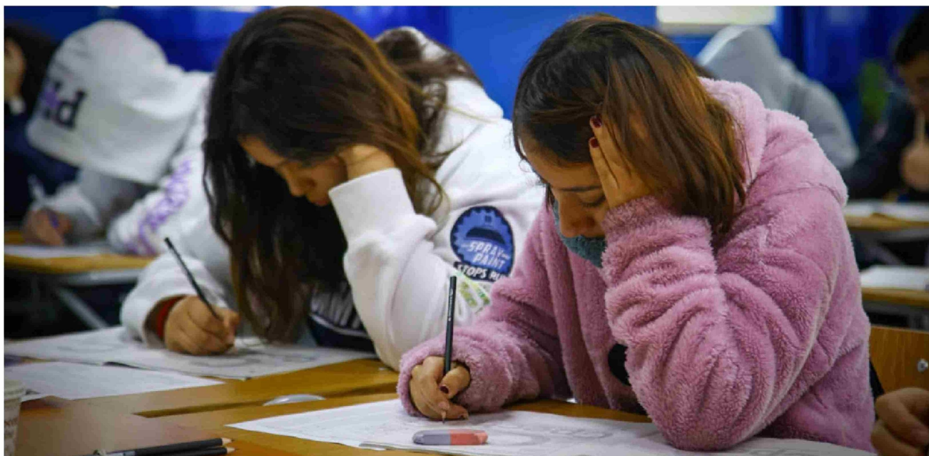
► La frustración por no alcanzar un objetivo puede generar tristeza, enojo e incluso afectar la percepción personal.