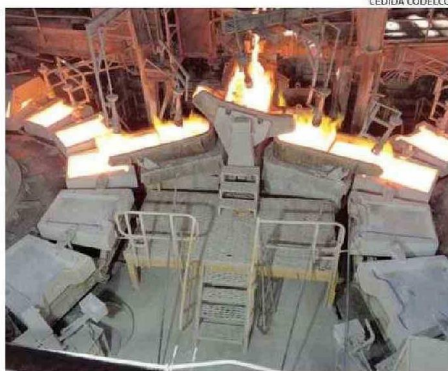
EXPERTOS DICEN QUE DESARROLLO ESTÁ LIGADO AL PRECIO DEL COBRE.