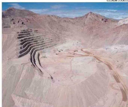
LA DIVISIÓN DE CODELCO SALVADOR ES LA MÁS GRANDE DE LA REGIÓN.