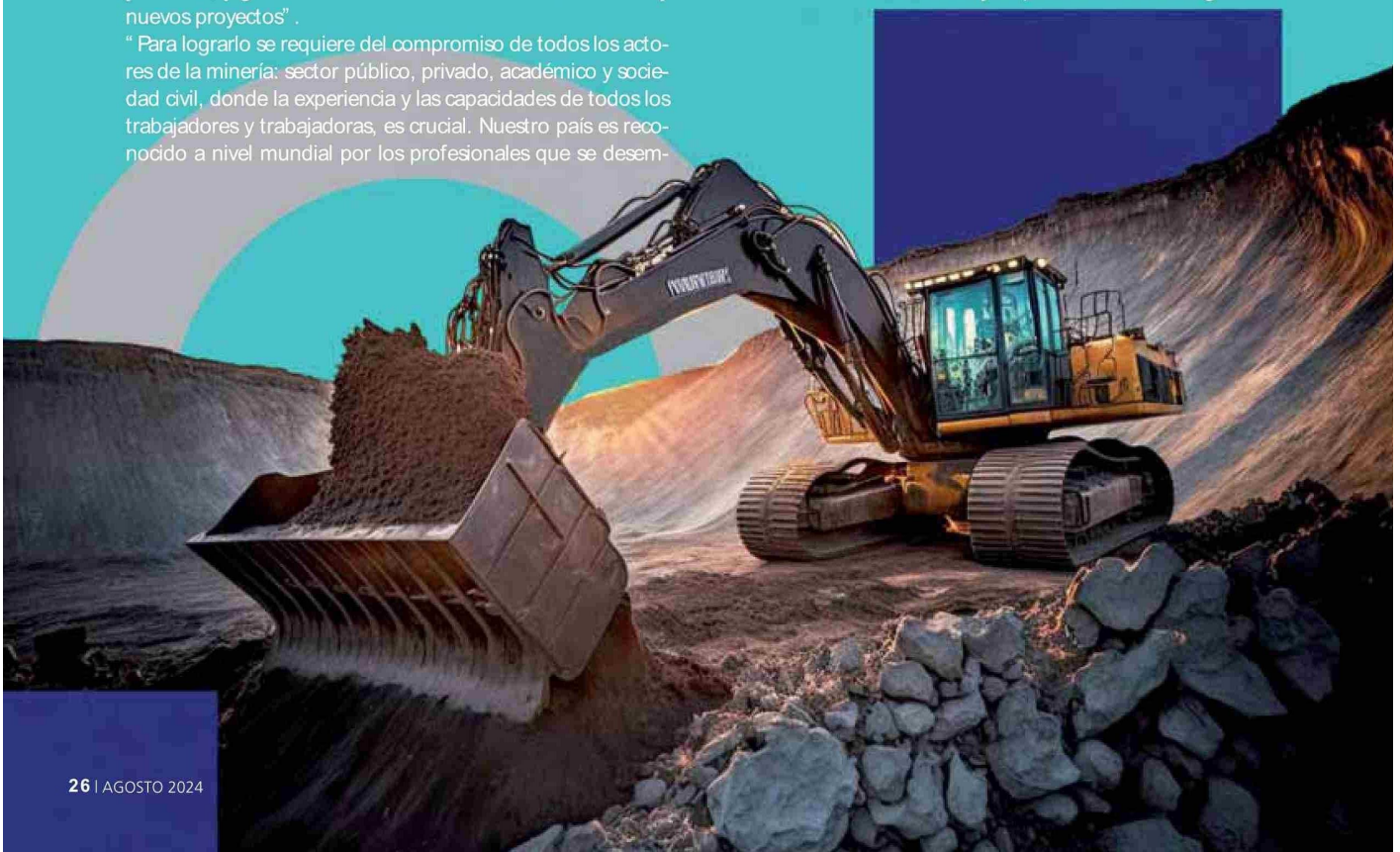
Ilustración: Fabián Paves

“En un nuevo mes de la minería, la invitación es a continuar fortaleciendo la cultura minera con más seguridad, innovación en los desafíos que el mundo nos impone y con mayor presencia femenina en las faenas y en posiciones de liderazgo”.