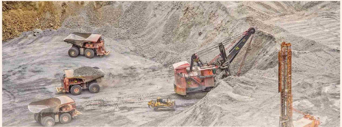
Las mayores transacciones cupríferas 2013-2024