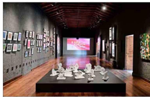
“Diálogos de Arte Contemporáneo”, en Vitacura.