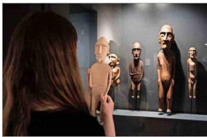
“Maestros Cultores de Rapa Nui”, en Providencia.