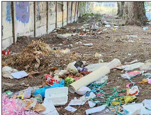
Esa basura no llegó ahí por sí sola.