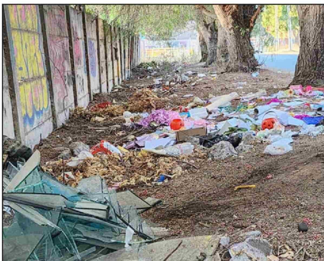
La situación debe cambiar en el sector y la basura limpiada.

aseo, estos lugares cuidar nuestro entorno y guardar nuestro basurero donde desecharla. El llamado a nuestra basura ha-