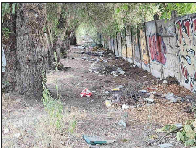
Más basura depositadas por personas inescrupulosas.