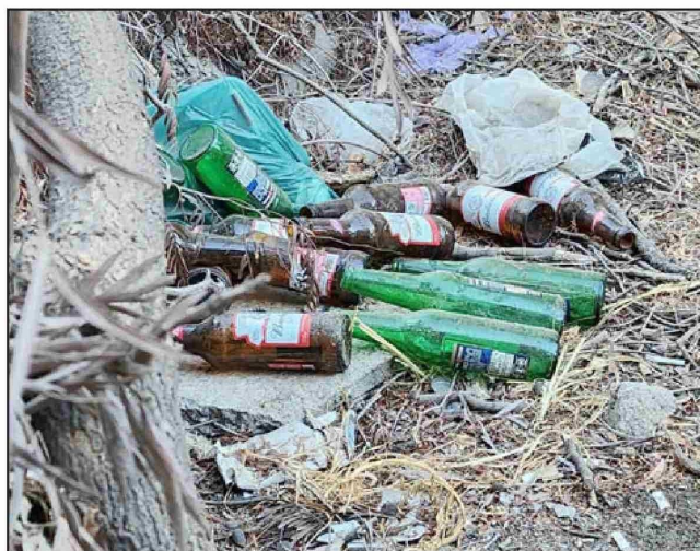
Botellas de vidrios, una constante de los residuos que son dejados a diario en el lugar.