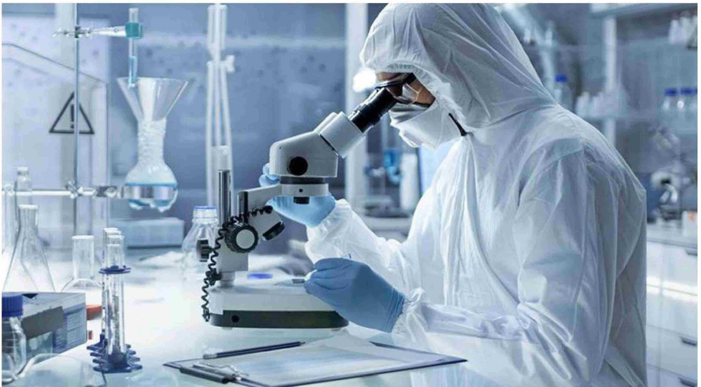
► La Streptococcus pyogenes está distribuida en el ser humano hace mucho tiempo y coloniza principalmente la faringe, vagina, recto y la piel.

Para diferenciarlo de los virus respiratorios, lo más representativo es el dolor de garganta con fiebre, pero que no esté asociado con una nueva secreción nasal, congestión nasal o tos. ●