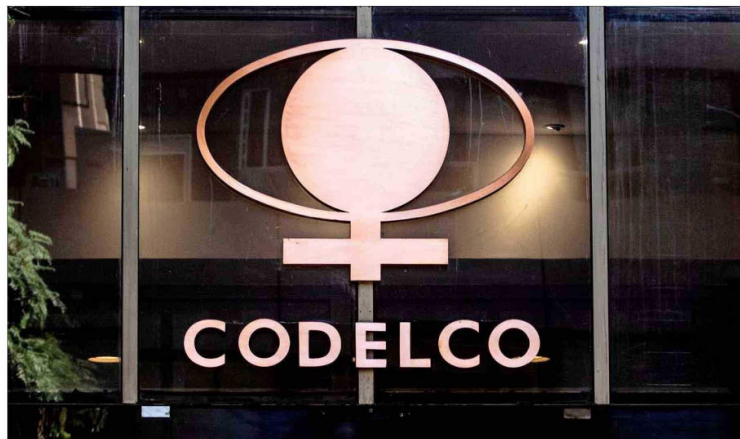
Los especialistas alertan de que una parte importante del endeudamiento de las empresas del Estado se explica por la situación financiera de la minera Codelco.