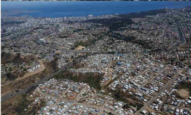
(Imagen comparativa a un año de la tragedia, Villa Independencia)

dencia. Pero ya era tarde... el fuego avanzó rápido y consumió centenas de viviendas en canal Beagle, luego siguió subiendo por El Olivar hasta Villa Independencia y Villa Rukán. Muchos no pudieron salir, y vieron cómo sus casas eran consumidas por las llamas sin poder hacer nada. Varios lograron escapar por la parte alta del campamento Manuel Bustos, hacia el camino