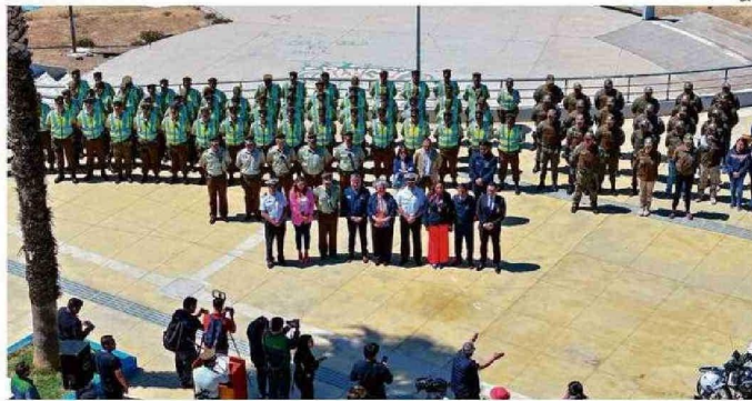
AUTORIDADES JUNTO AL CONTINGENTE POLICIAL QUE REFUERZA LA DOTACIÓN EN EL VERANO.

El representante del Ejecutivo en la región destacó que "la delegación presidencial provincial ha hecho un trabajo relevante en coordinar a todas las instituciones del Estado y