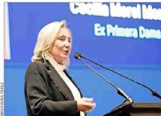
La viuda del Presidente Piñera, Cecilia Morel, destacó su valentía y entrega.