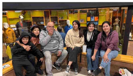
Visitantes de la vecina localidad de Río Turbio.