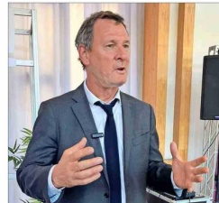
El economista también expuso sobre cómo elevar la productividad en la industria de la construcción.

—¿Cómo así? "Plantear que la manera de salvar el planeta es no crecer es algo que no va a ocurrir: ningún sistema o régimen se ha propuesto nunca dejar de crecer. Sería además totalmente equivocado, porque todavía hay muchas necesidades básicas por cubrir. En todo el mundo, incluso en EE.UU. o Europa. Basta ver los problemas que tienen con la migración. Entonces, es errado sentirse en una empresa (o en cualquier organización) a discutir cuánto estamos dispuestos a sacrificar de crecimiento, rentabilidad o utilidad para hacer del mundo un mejor lugar. La pregunta correcta es cómo mejorar la productividad para tener un planeta mejor y a la vez seguir creciendo, rentabilizando y ganando plata.