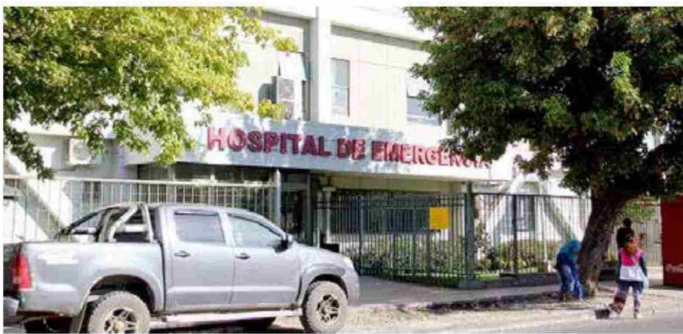
El Hospital de Emergencia lleva varios meses desocupado y todavía no hay proyectos concretos para un nuevo uso.

Postura. Dirigentes vecinales piden que instalaciones desocupadas sean pronto traspasadas al municipio.