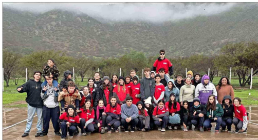
El grupo del Colegio San Miguel Arcángel en Las Puertas, en Cabilido.