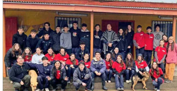
En Guayacán, Cabilido, Valparaíso, el grupo del Colegio San Miguel Arcángel.