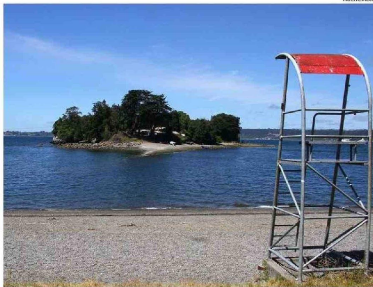
LA PLAYA DE CHINQUIHUE, UBICADA FRENTE A LA ISLA DE LOS CURAS, SERÁ UNA DE LAS QUE SERÁ HABILITADA EN PUERTO MONTT.

muchas veces ocurren en el período estival”.