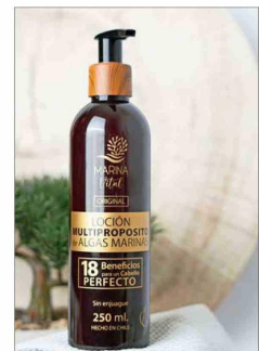
Loción multipropósito de algas marinas, el producto central de Marina Vital.