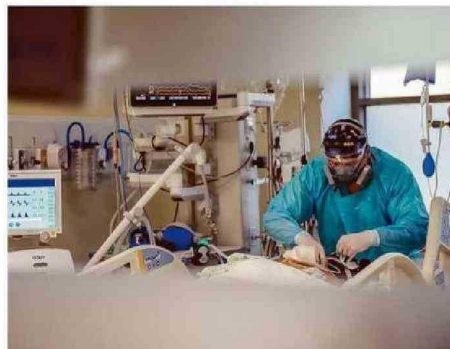
RESOLUCIÓN DE ESTAS LISTAS ES UNA DEMANDA COMPARTIDA.

"De acuerdo a la información de la subsecretaría de Redes, son cerca de 800 mil millones de pesos que se requieren para resolver las listas de espera quirúrgicas y de atención por especialidad. Esta cifra lógicamente es una cifra elevada y que desde nuestra perspectiva requiere ser enfrentada de manera planificada y establecer un acuerdo país de cuánto es el tiempo máximo de espera que debiéramos establecer para cada paciente, para cada patología, tanto en consulta de especialidad como en cirugía, y establecer un plan", aseveró el representante