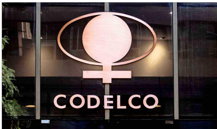
Los especialistas alertan de que una parte importante del endeudamiento de las empresas del Estado se explica por la situación financiera de la minera Codelco.