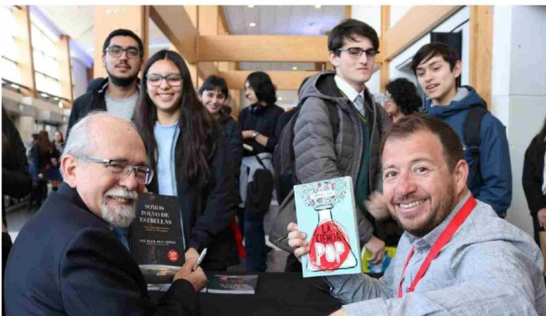
EN LAS DOS PRIMERAS VERSIONES del evento participaron más de 10 mil asistentes.

El encuentro además es patrocinado por el Ministerio de Ciencia, Tecnología, Conocimiento e Innovación y las delegaciones desde los colegios se pueden inscribir de manera gratuita en www.2100.cl