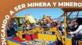
En Antofagasta y Calama, 3.000 niños conocieron de manera interactiva este mundo productivo.