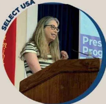
Bernadette Meehan, Embajadora de EE.UU., presentó las oportunidades de negocios para PYMES en ese país.