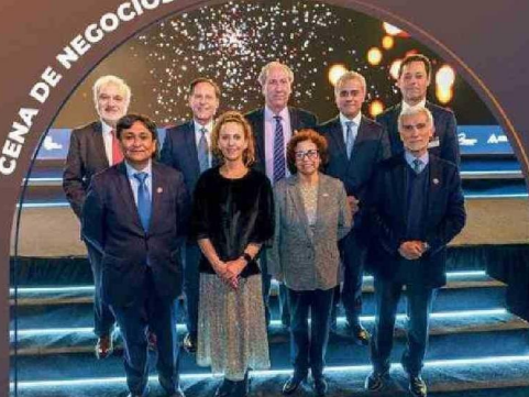
AIA celebró sus 80 años junto a más 1.200 ejecutivos de la industria minera, autoridades y líderes nacionales.