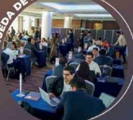
Sobre mil reuniones de negocios y 600 empresas asistentes, a este networking con proveedores.