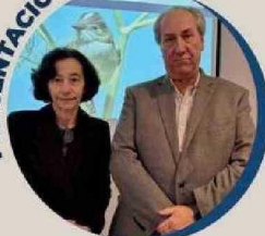
Rossana Costa, Presidenta del Banco Central, destacó el crecimiento económico impulsado por la industria minera y energética, reflejado en el Informe de Política Monetaria.