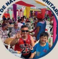
Mil niños del Servicio Mejor Niñez, barrios transitorios y jardines infantiles disfrutaron en familia, de este especial momento.