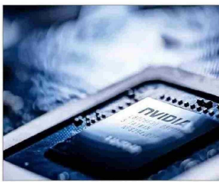
Nvidia es una empresa que diseña chips y que había destacado por el creciente precio de su acción.