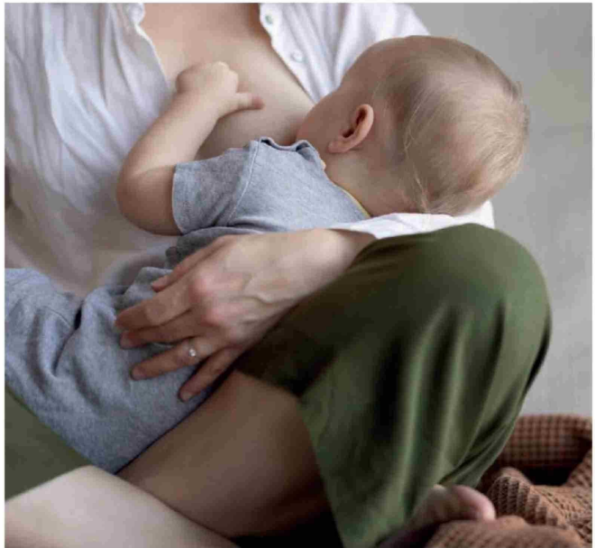
LA LACTANCIA MATERNA previene enfermedades gastrointestinales y respiratorias, entre otras.

Son múltiples los beneficios que trae consigo la lactancia materna en los