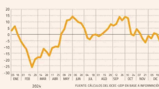
COSTO FISCAL BRUTO DEL MEPCO EN 2024 MILLONES DE DÓLARES