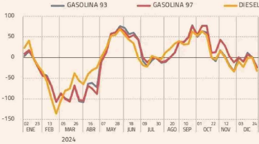
COMPONENTE VARIABLE DEL IMPUESTO ESPECÍFICO FINAL $/LITRO