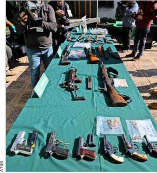
Incautaciones de armas de grueso calibre, y también arrestos, fueron ajustados a derecho, afirmaron en Carabineros y la fiscalía.

También desde SD, el presidente de la comisión de Minería y Energía, Juan Luis Castro (PS), contestó, a favor de Tohá, que “es inaceptable volver a criticar al Gobierno en un tema grave de segu-