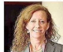
Ministra María Gajardo Harboe

● Ministro de la Corte Suprema desde el año 2019. Antes fue ministro de la Corte de Apelaciones de Santiago.