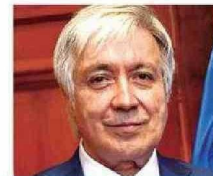
Ministro Mauricio Silva Cancino

● Ministro de la Corte Suprema desde el año 2017. Ingresó al máximo tribunal en el cupo de abogado externo.