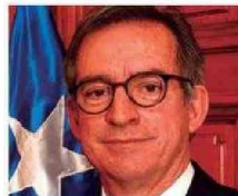
Ministro Arturo Prado Puga

● Asumió como ministro de la Corte Suprema el año 2005, siendo propuesto por el ex-Presidente Ricardo Lagos.