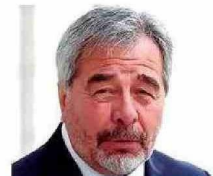
Ministro Gabriel Ascencio Mansilla

● Ministra de la Corte Suprema desde el año 2022. Fue directora de la Escuela de Postgrado de Derecho de U. de Chile.